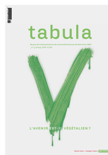
tabula 3/16: L'avenir est-il végétalien?