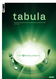
tabula 1/16: Les superaliments