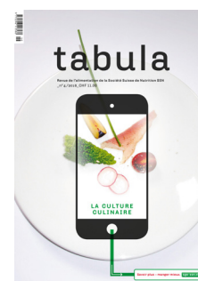
tabula 4/16: La culture culinaire